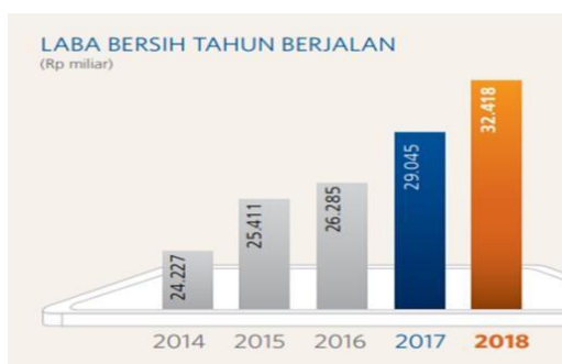
Gambar 1.1. Tren laba bersih Bank BRI

Rakyat Indonesia Tbk (BRI) yang terdaftar di indeks LQ45 sebagai berikut: