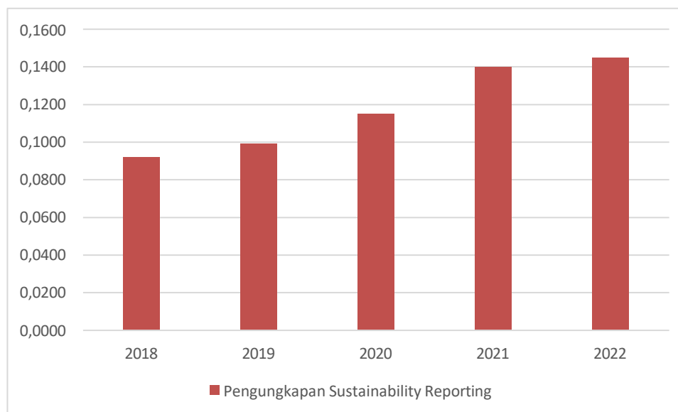
Tabel 1. Perkembangan Pengungkapan Sustainability Report tahun 2018 - 2022

Berkembangnya pengungkapan Sustainability Report tidak terlepas dari pengaruh Profitabilitas Perusahaan dan Ukuran Perusahaan Perusahaan Sektor Kesehatan Sub Sektor Jasa Penyedia Kesehatan dan Sub Sektor Farmasi.