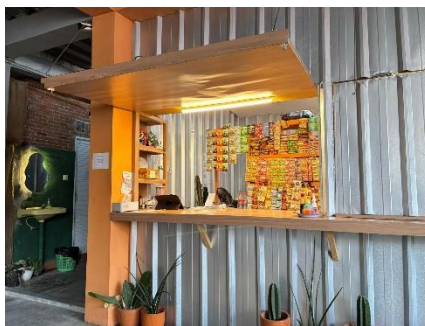
Gambar 1: Usaha “Warung Olis”

Penelitian ini menggunakan metode kualitatif dengan pendekatan studi kasus. Data primer diperoleh melalui wawancara dengan pemilik usaha dan observasi langsung terhadap kegiatan operasional. Sementara itu, data sekunder diperoleh melalui studi pustaka dan literatur yang relevan dengan manajemen risiko dan UMKM. Pendekatan ini dipilih karena mampu memberikan pemahaman yang mendalam mengenai proses manajemen risiko yang diterapkan oleh pelaku usaha dalam konteks nyata (Amelia, 2023). Studi kasus dilakukan pada Warung Olis, sebuah usaha kuliner yang berlokasi di sekitar kampus dan menghadapi berbagai risiko operasional dan keuangan. Analisis data dilakukan melalui tahapan identifikasi risiko, pembobotan atau skoring risiko berdasarkan tingkat kemungkinan dan dampak, evaluasi risiko untuk menentukan prioritas penanganan, serta penyusunan mitigasi risiko sebagai dasar penarikan kesimpulan penelitian.