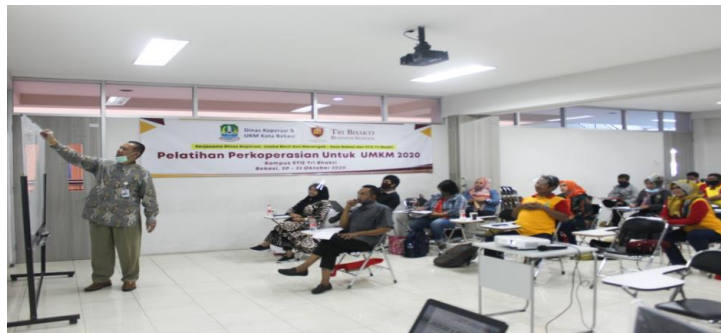
Gambar 1 Penyampaian Materi Akutansi Koperasi.

Pelatihan di hari ketiga para peserta diminta untuk melakukan praktek latihan penyusunan, cara membaca dan analisa laporan keuangan Koperasi. Penyaji telah mempersiapkan contoh soal yang sederhana dan sesuai dengan bidang usaha Koperasi dan penyaji memberikan pendampingan dalam membantu peserta mengerjakan tugas di kertas kerja untuk membuat laporan keuangan. Dengan metode ini diharapkan para peserta lebih mudah memahami dan dapat dilaksanakan pada organisasinya untuk periode selanjutnya.