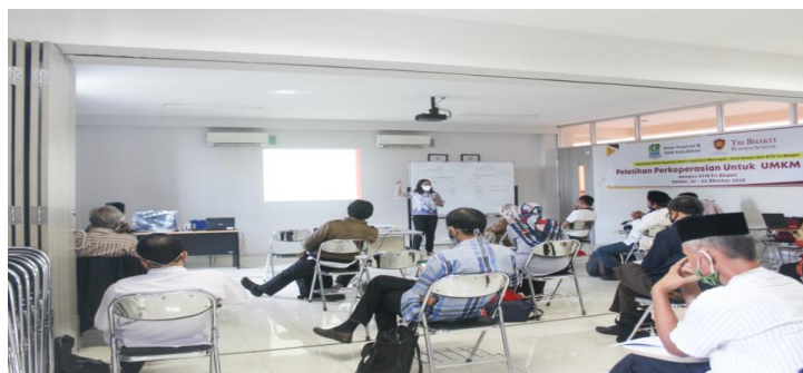
Gambar 2 Penyampaian Materi Penyusunan Laporan Keuangan Koperasi.